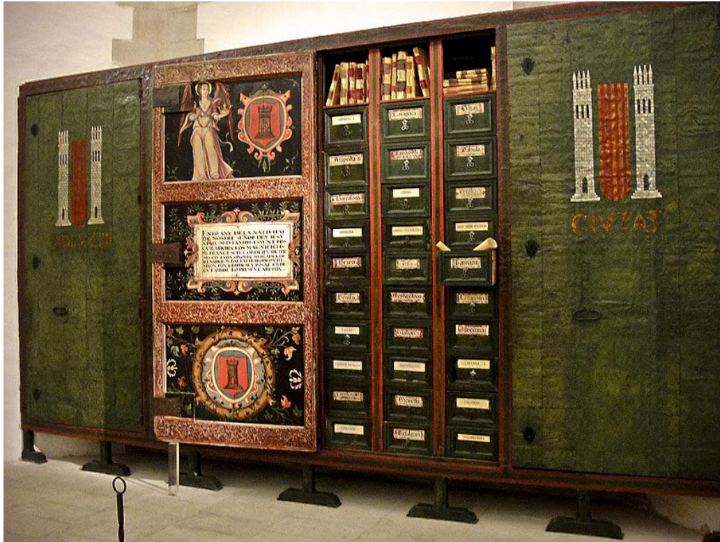
Antic Armari-arxiu de la ciutat. Està decorat amb els escuts de la ciutat i el de la vegueria i l'àngel custodi, antic patró de la ciutat. Construït el 1574, estigué en us fins la darrera dècada del segle XX. Actualment es troba en el Centre d'Interpretació del Renaixement, ubicat a l'església de Sant Domènec.